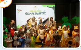
Spectacular (Perayaan akhir tahun ajaran)