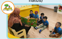
Penutup (cerita, refleksi, dan bermain)