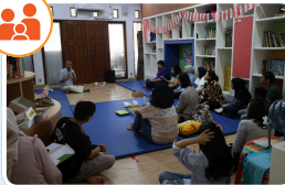
Faction (parenting class)