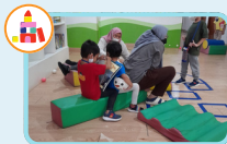
Aktivitas dalam ruangan (kemampuan motorik halus)