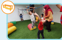
Aktivitas luar ruangan (kemampuan motorik kasar)